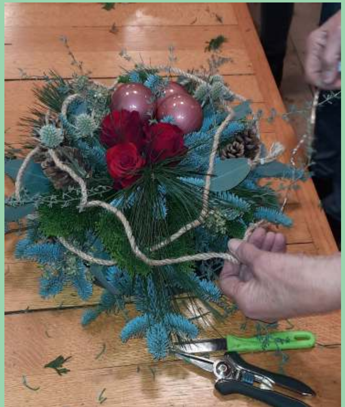
Foto: de creatie van vorig jaar.

Nadere informatie m.b.t. kosten, locatie enz. volgt t.z.t. in een nieuwsbrief.